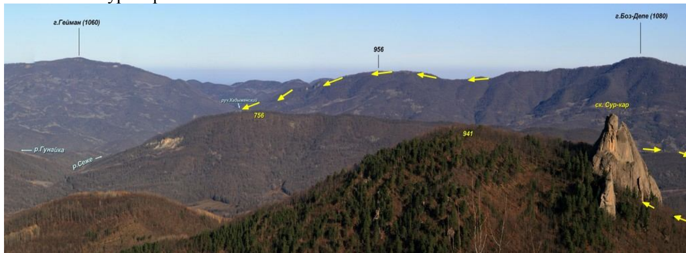
Скала Сур-Кар со стороны Канжанских скал

От ур. Энкзенут 2,5 км. подъема по старому волоку к доминирующей в этом районе скале Сур-Кар: