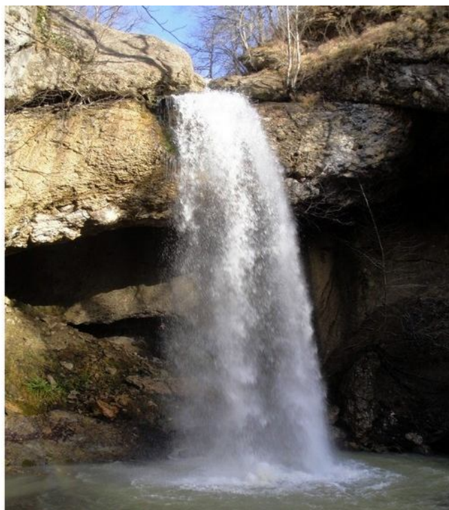
Водопад на руч.Хадыженском (Инструкторский).

От водопада туристы по дороге вдоль ручья Хадыженского спускаются в долину реки Гунайка (старое название реки и долины Сеже).