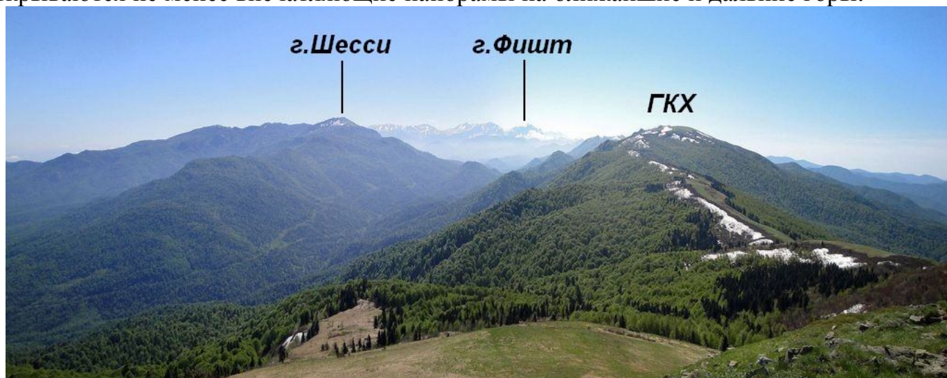
Вид с горы Перевальной (Семашко-2) (1453).

С вершины Перевальной (Семашко-2), которая расположена рядом с Батарейной открываются не менее впечатляющие панорамы на ближайшие и дальние горы: