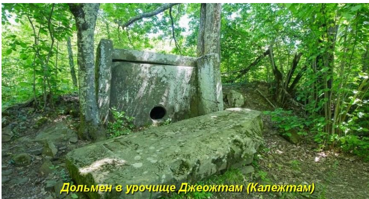
Дольмен в урочище Джеожтам (Калежтам)