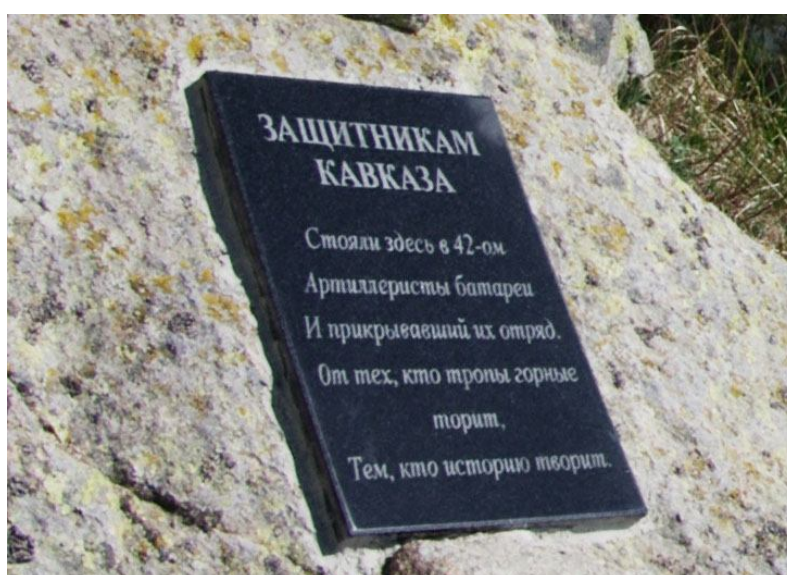
Мемориальная доска на горе Батарейной (1403).