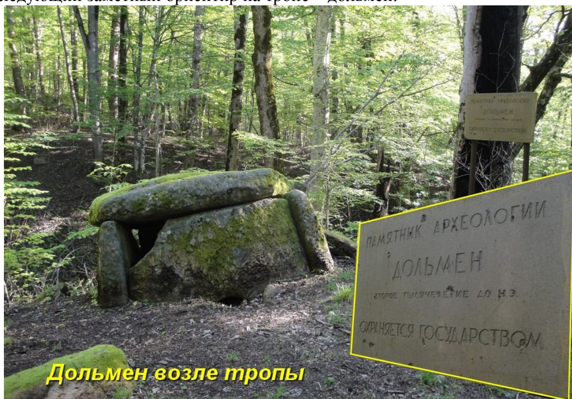
Дольмен возле тропы

Следующий заметный ориентир на тропе – дольмен: