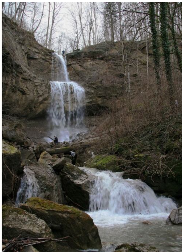
Водопад на р.Хадажка (летом и зимой).

От развилки на Хадажке до водопада 1 км. пути. Водопад обходится справа по ходу вверх. После водопада туристы выходят к уже упомянутой дорожке, накатанной квадрациклами, а по ней поднимаются к основной лесовозной дороге, идущей по склонам от ур.Чертов мост. От водопада до этой дороги чуть больше 1 км. Свернув по этой дороге влево через 600 метров туристы подходят к озеру Новому (8 км. от Травалева). Озеро это на самом деле искусственный пруд. На берегу озера Нового хорошее место для организации бивака.