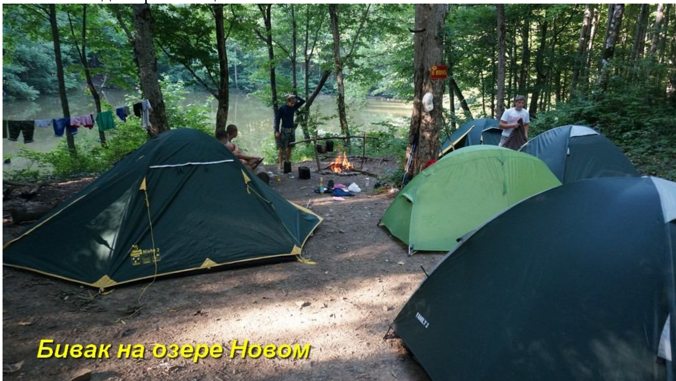
Бивак на озере Новом

От развилки на Хадажке до водопада 1 км. пути. Водопад обходится справа по ходу вверх. После водопада туристы выходят к уже упомянутой дорожке, накатанной квадрациклами, а по ней поднимаются к основной лесовозной дороге, идущей по склонам от ур.Чертов мост. От водопада до этой дороги чуть больше 1 км. Свернув по этой дороге влево через 600 метров туристы подходят к озеру Новому (8 км. от Травалева). Озеро это на самом деле искусственный пруд. На берегу озера Нового хорошее место для организации бивака.