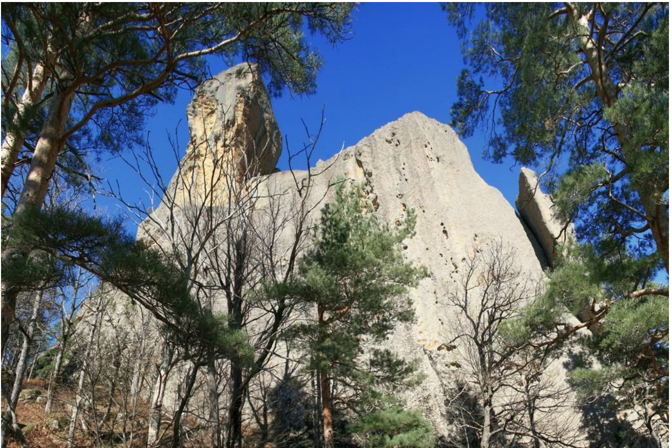
У подножья скалы Сур-Кар

От скалы Сур-Кар маршрут продолжается в сторону долины реки Пшиш. Сначала короткий спуск по дороге к броду через Гучасскую Щель (1,5 км. от скалы). На этом участке на 1-й развилке надо повернуть направо, а от поляны перед бродом – налево (Внимание! Основная дорога в этом месте уходит направо).