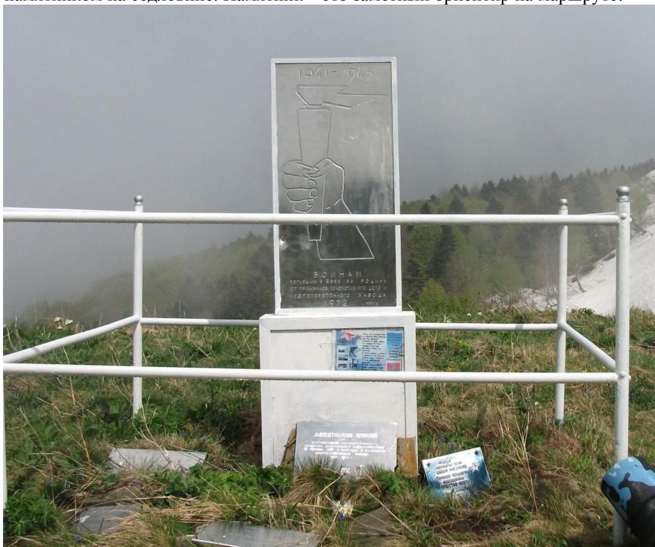
Памятник на перевале Семашко-2

Линейная часть маршрута продолжается от места ночевки под горой Батарейной. Предстоит несложный подъем на перевал в Главном водораздельном хребте «Семашко-2» с памятником на седловине. Памятник – это заметный ориентир на маршруте: